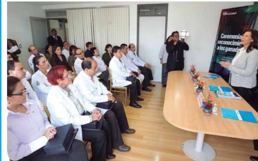
Concurso de Jefaturas Médicas promueve la meritocracia y la transparencia.

EsSalud culminó con éxito la primera convocatoria del Concurso de Jefaturas Médicas para Departamentos y Servicios en los centros asistenciales de todo el país, que permitió cubrir 315 plazas, de las cuales 104 corresponden a jefes de departamento y 211 a jefes de servicio. Esta primera convocatoria del concurso se realizó entre los meses de junio y setiembre pasados. Se tiene previsto llevar a cabo otras dos convocatorias para cubrir las 652 plazas restantes y completar así las 967 vacantes con