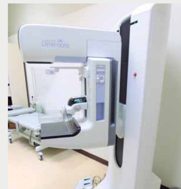
El 40% de los casos de cáncer de mama es diagnosticado en fases avanzadas.

La Red Asistencial Sabogal de EsSalud ya cuenta con un nuevo mamógrafo 3D para la realización de pruebas de detección precoz del cáncer de mama a través de la modalidad de tamizaje. Dicha evaluación médica se recomienda en mujeres entre los 50 y 74 años de edad, cada 24 meses, y en aseguradas con factores de riesgo cada año. El moderno mamógrafo facilita el diagnóstico temprano de lesiones y la reducción del tiempo de espera para la entrega de los resultados. Con este equipo digital -valorizado en un millón 500 mil nuevos soles-, se realizan estudios tridimensionales que brindan un diagnóstico del cáncer de mama en estadios más tempranos, considerando que el 40% de los más de 3,500 casos anuales que se presentan en el país, es diagnosticado en fases avanzadas. La mamografía 3D mejora significativamente la visualización del tejido mamario, así como la visualización de las micro-