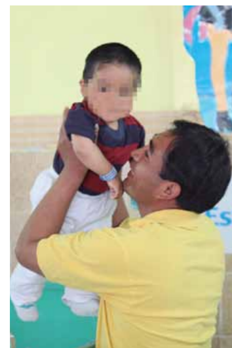
El soporte de los padres contribuye a la recuperación.