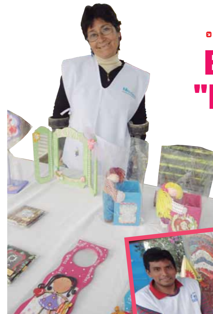
El 3 de diciembre de cada año se conmemora el Día Internacional de las Personas con Discapacidad.

Seguro Social fortalece iniciativa que fomenta creación de micro empresas y que ha beneficiado a más de 7 mil familias.