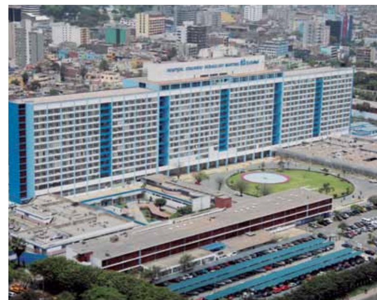
La Red Asistencial Rebagliati cuenta con un millón 700 mil adscritos.