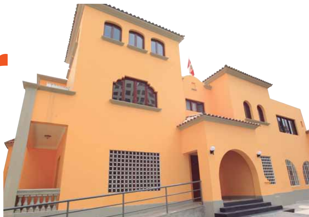
La casa albergue.

Será como un hogar lejos del hogar, donde tendrán un techo para descansar y recuperarse mientras su pequeño esté internado.