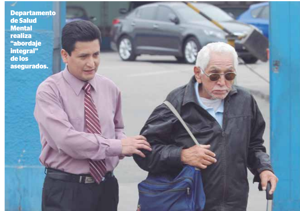
Departamento de Salud Mental realiza "abordaje integral" de los asegurados.