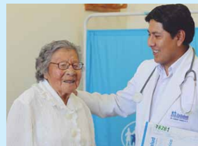
Los asegurados tienen derecho a recibir atención médica de calidad, con oportunidad.

Para más información, el afiliado puede acercarse a las oficinas de la Defensoría del Asegurado en los centros asistenciales de EsSalud, en horarios de oficina, llamar al 411-8000 o al 0801-10-900 (provincias), ingresar a la página web www.essalud.gob.pe y/o escribir al e-mail defensoria-delasegurado@essalud.gob.pe