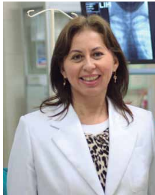
La doctora Paredes investiga sobre la prevención del cáncer en niños.

UNA VIDA DEDICADA AL SERVICIO DE LA HUMANIDAD