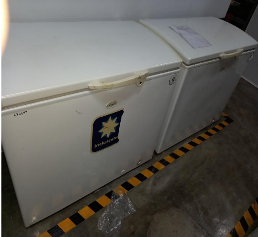
Sala de Cadena de Frio