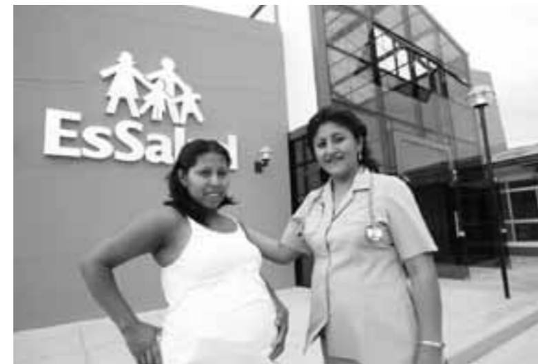
Modernidad con calidez

Los profesionales de la salud estamos formados para servir al prójimo, salvo que a alguien no le guste su carrera.