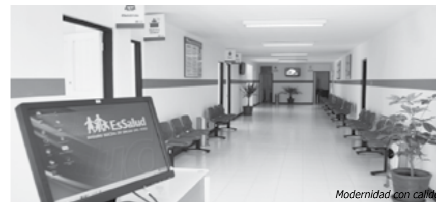
Modernidad con calidez

Anunció que se aprobó la construcción del nuevo hospital de Tingo María y las obras continuarán.