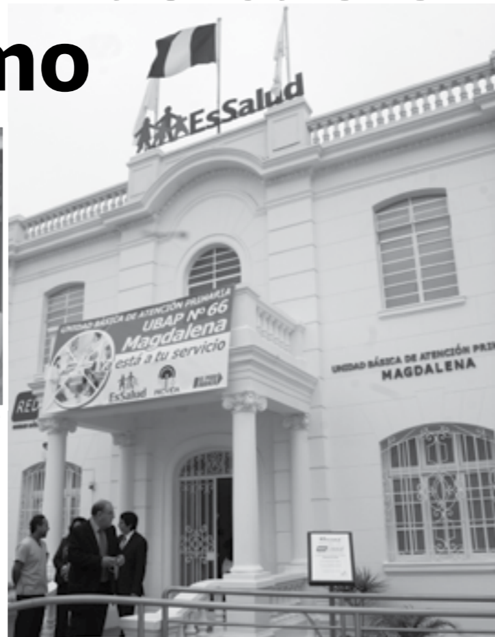
Atención primaria en Magdalena

Añadió que las obras continúan y las macrorregiones cuentan con moderna infraestructura y equipos de cámara gamma, acelerador lineal, resonador magnético, litotriptor, mamógrafo, densitómetro, entre otros.