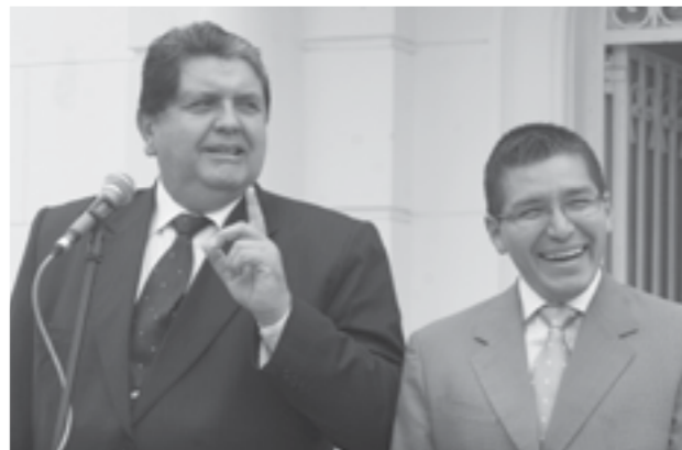
La alegría de servir al asegurado

E l presidente de la República, Alan García, puso en movimiento un nuevo modelo de gestión al inaugurar la Unidad Básica de Atención Primaria (UBAP) No. 66 en Magdalena, mediante convenio con la organización no gubernamental (ONG) Provida que atenderá a más de 100 mil pacientes.