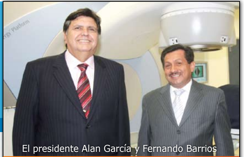
El presidente Alan García y Fernando Barrios Obras para salvar vidas en el norte del país