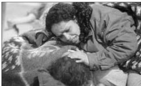
El dolor de una madre frente a la furia de la naturaleza no perdona ni a los niños

Todos Somos EsSalud, porque Todos Somos el Perú