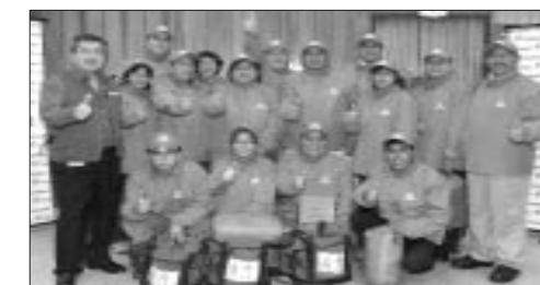
Brigadistas ya están en la zona de desastre