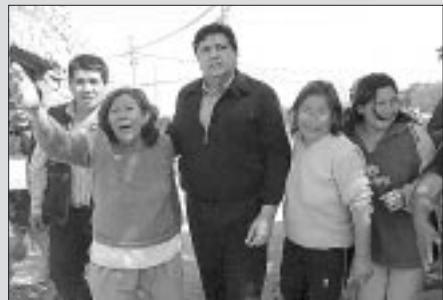
Presidente Alan García en la zona del desastre

Minutos antes de su arribo una pala mecánica traía por los suelos la cúpula de la catedral de San Germán, lo último que quedaba luego del movimiento telúrico.