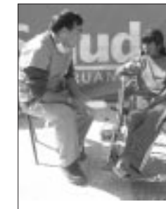
Psicólogo en plena entrevista

Lo más importante es empezar a normalizar la salud mental de las personas en la etapa post traumática, es de-