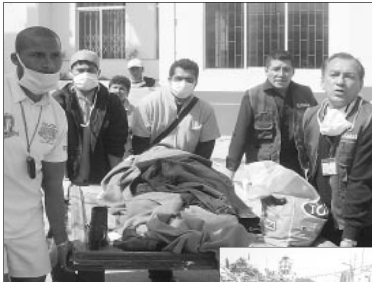
Sin demora heridos son evacuados a hospitales de EsSalud en Lima

Y debo lamentar que también existan los indiferentes,