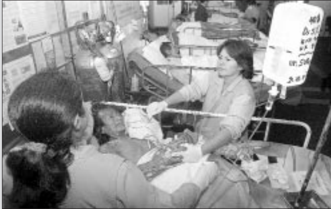
Ni el dolor ni el terremoto impiden la labor del personal de EsSalud