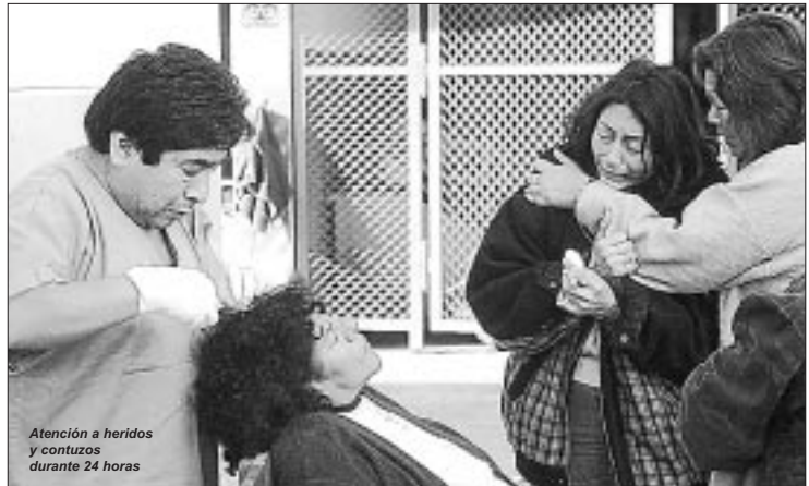
Atención a heridos y contusos durante 24 horas