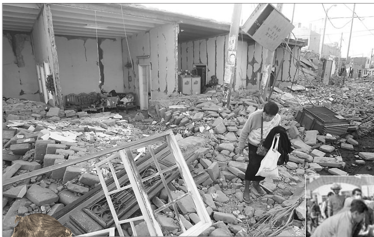
La furia de la naturaleza deja casas derruidas, dolor y llanto en los hogares

Sin embargo, el Presidente ejecutivo, hizo un llamado a los trabajadores, médicos, enfermeras, técnicos y administrativos a fin de sobreponerse al dolor y angustia y trabajar por la salud y la vida de los asegurados y de la población afectada, sin distinción porque se trataba de hermanos en desgracia.