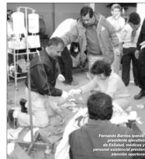
Fernando Barrios Ipenza, presidente ejecutivo de EsSalud, médicos y personal asistencial prestan atención oportuna