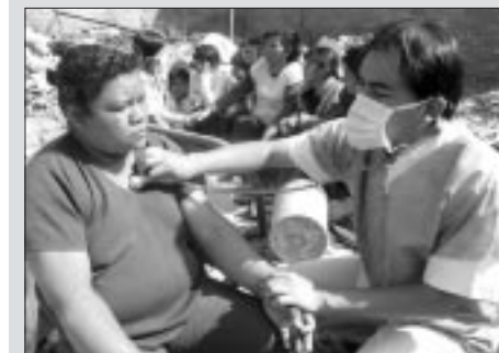
Al día siguiente del fenómeno sísmico brigadas de EsSalud prestan atención a familias sobre los escombros de sus hogares.

La vida de los semejantes está por encima de miedos y temores. Brigadas de médicos y enfermeras de EsSalud se desplazan por calles y sectores alejados del centro de Pisco y atienden los requerimientos primarios de los pobladores.