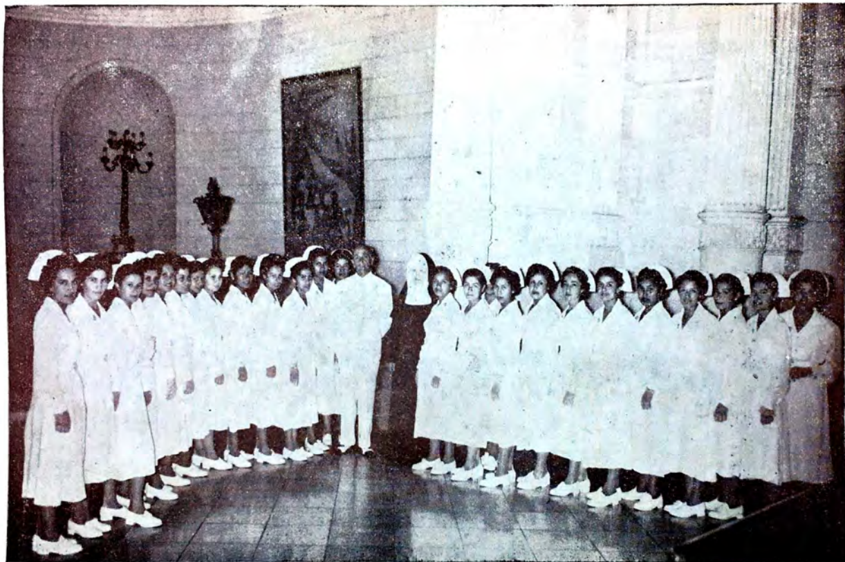
El Señor Presidente Constitucional de la República Dr. Manuel Prado, en compañía de las señoritas integrantes de la Promoción que lleva su nombre