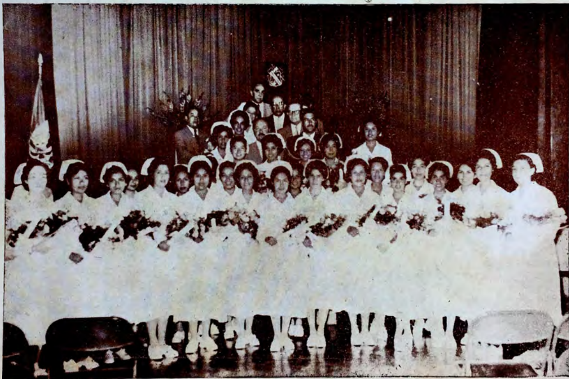
XIV Promoción de Enfermeras "Dr. Manuel Prado"

SECRETARÍA GENERAL Oficina de Servicios de la Información Archivo Central