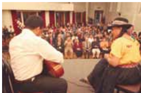
El público ovacionó los villancicos andinos.

Logró la fama al ganar amplia popularidad dos composiciones cuyas interpretadas por el trío