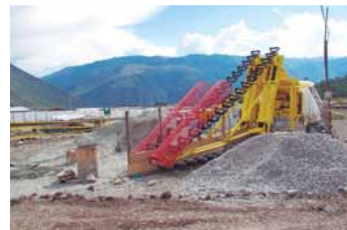
La construcción del nuevo hospital de Abancay avanza a ritmo acelerado.

Puntualizó que la entrega del equipo de alta tecnología se enmarca dentro de