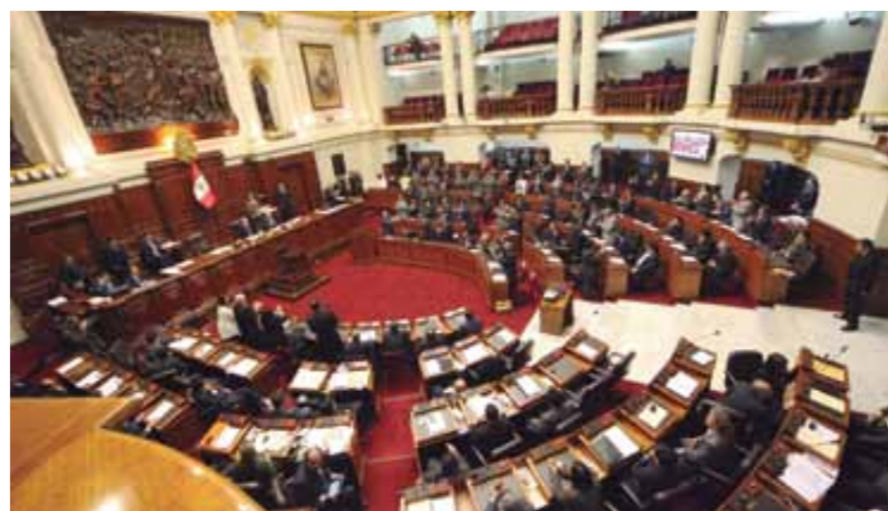
Hemiciclo del Congreso de la República.

Para respaldar la lucha permanente contra la corrupción, pidió al Poder Legislativo restaurar el Consejo de Vigilancia en el Consejo Directivo Tripartito de EsSalud, órgano de control que fue eliminado en la década de los noventa. Señaló que la equivocada decisión del gobierno de ese entonces abrió el camino para la corrupción y uso indebido de los recursos del Seguro Social, que pertenecen a los trabajadores aportantes.