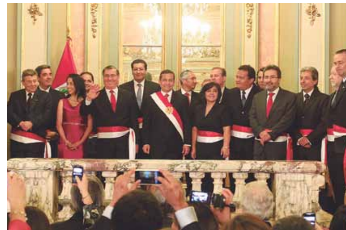
El presidente de la República, Ollanta Humala Tasso y los integrantes de su Gabinete Ministerial.

EL PRESIDENTE CONSTITUCIONAL DE LA REPÚBLICA, OLLANTA HUMALA TASSO, TIENE NUEVO GABINETE MINISTERIAL, EL CUAL BUSCA FORTALECER EL PROCESO DE INCLUSIÓN SOCIAL.