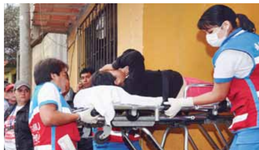
Con el SAMU, salud para todos.

“ Profesionales médicos, enfermeras, personal asistencial y toda la infraestructura hospitalaria del Seguro Social, que constituye la vanguardia científica del país, están preparados y listos para atender el SAMU con eficiencia y trato humano. ”