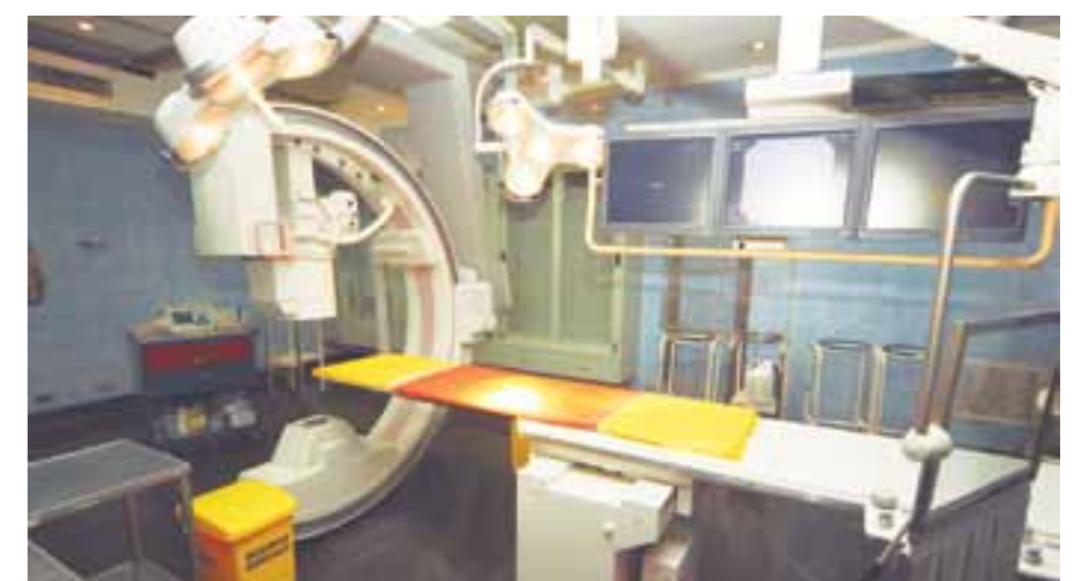
El angiógrafo digital brinda imágenes de alta definición para diagnóstico y tratamiento de enfermedades cardiovasculares.

El angiógrafo digital permite obtener imágenes de alta definición (HD) para el diagnóstico y tratamiento de enfermedades cardio-