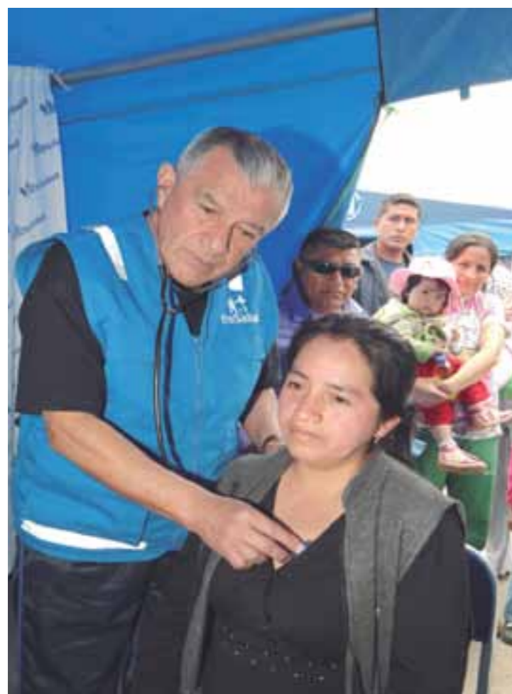
Ejerciendo su labor de médico, en una de las campañas de salud gratuitas.