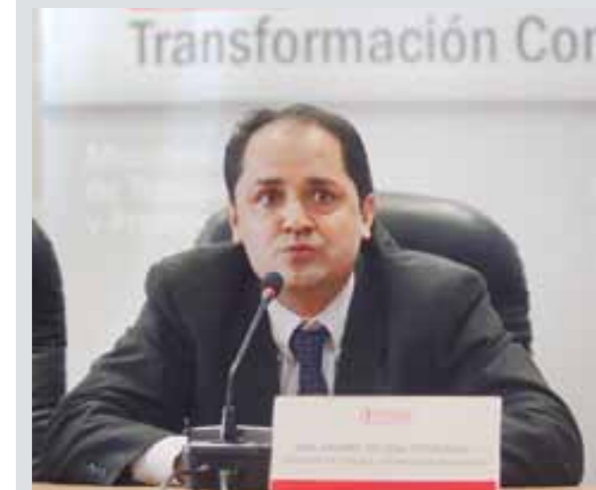
Ministro de Trabajo y Promoción del Empleo, José Villena Petrosino.

La generación de empleo en el país y el impacto de los programas sociales a cargo del sector son las tareas prioritarias del nuevo ministro de Trabajo y Promoción del Empleo.