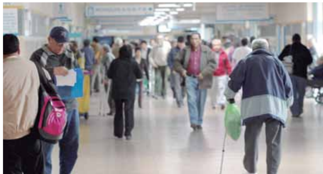
Centros de atención primaria serán potenciados con nuevos equipos y personal médico.

Con este propósito, las diversas redes asistenciales de Lima, Callao y provincias, vienen implementando una serie de mejoras en sus respectivos centros de