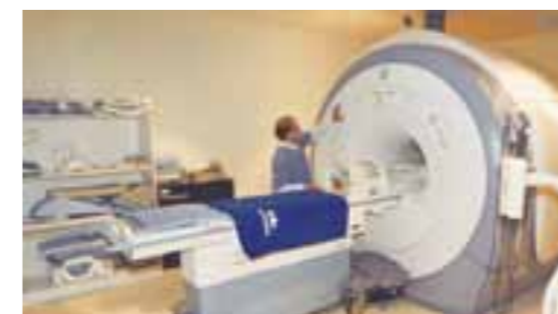
El resonador magnético permite producir imágenes de altísima calidad de diversos órganos del cuerpo.

El Seguro Social invirtió en la adquisición de los dos equipos más de dos millones de dólares.