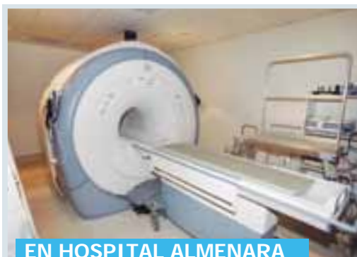
EN HOSPITAL ALMENARA