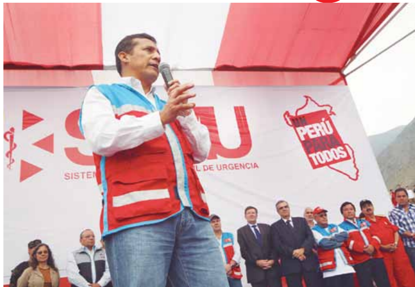
La atención de salud a la población más vulnerable destacó el presidente de la República, Ollanta Humala Tasso.

toda una red de salud que incluye a las salas de emergencia de los hospitales o clínicas. Se trata de un servicio que atenderá a todas las personas, afiliadas o no a algún tipo de seguro, en establecimientos del Seguro Social y del Ministerio de Salud.