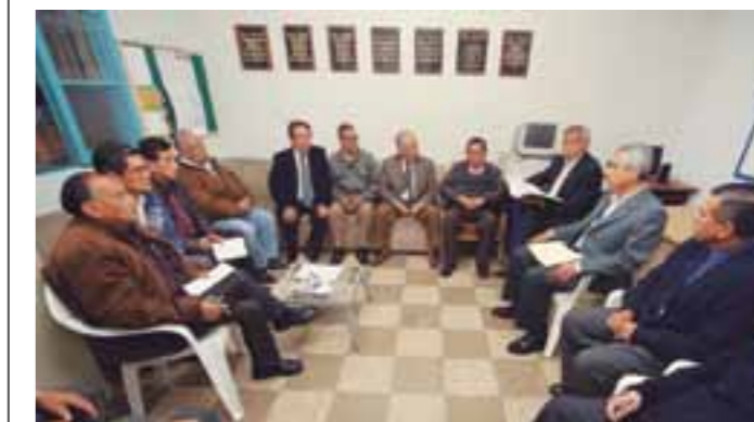
Dirigentes de la ANCIJE en reunión con funcionarios de EsSalud.

EsSalud ampliará y fortalecerá, a partir del próximo año, los servicios asistenciales a los Cesantes y Jubilados de Educación, en virtud del convenio que suscribirá con la Asociación Nacional de Cesantes y Jubilados de Educación (ANCIJE), anunció