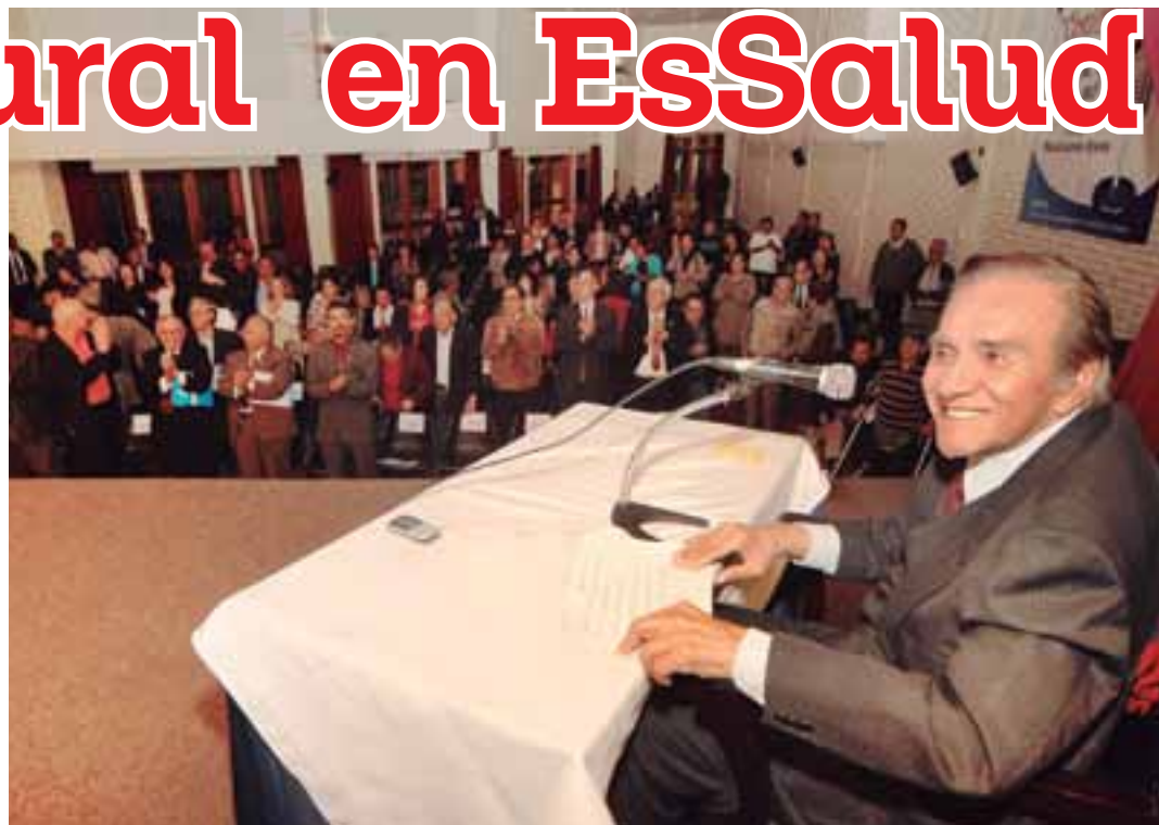
El ciclo de jornadas culturales en EsSalud empezó con un homenaje al cantautor Manuel Acosta Ojeda.

"Los Chamas" en 1955, los valeses: En un Atardecer y Madre. Es autor de numerosas canciones populares como los valeses Cariño, Ya se muere la tarde, Si tú me quisieras, entre otras.