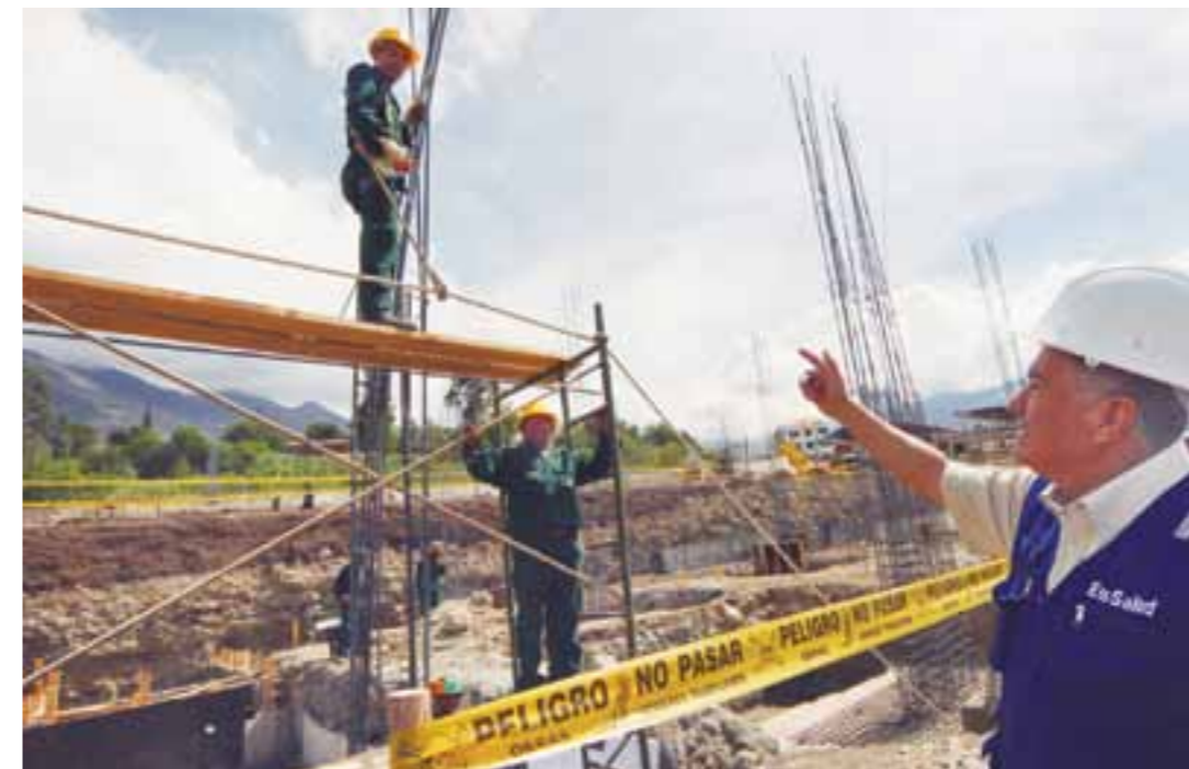
Durante visita a Apurímac se inspeccionaron las obras del nuevo hospital de Abancay.

El nuevo hospital II de EsSalud en la ciudad de Abancay, capital de la Región Apurímac, será inaugurado a fines del próximo año, ratificó el presidente ejecutivo del Seguro Social de Salud, Dr. Álvaro Vidal Rivadeneyra, en la ciudad de Abancay.