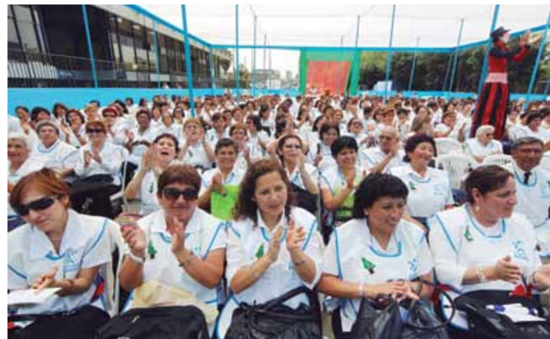
Los voluntarios compartieron gratos momentos por motivo del Día Internacional del Voluntariado y las fiestas de fin de año.