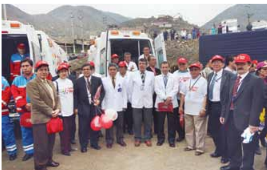
El equipo de EsSalud presente en la ceremonia de lanzamiento del SAMU.

A través del SAMU se atenderá gratuitamente las emergencias mediante