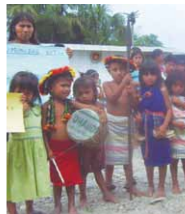
Comunidad de Nievapipi wawakuna.

T'aqa t'aqa medicokunan puririnqaku Nieva, Santiago, Cenepa, Marañón mayukunah