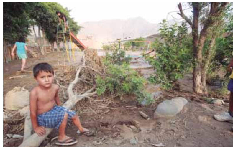
Aswan waxcha wawakunantan EsSalud yanapayushan.

suyupi tiyakunatahmi nishu k'irisqa rixuripunku. Tawa pachax pusahchunka runakunatahmi wasinkuh urmayusqanta qhawarinku.