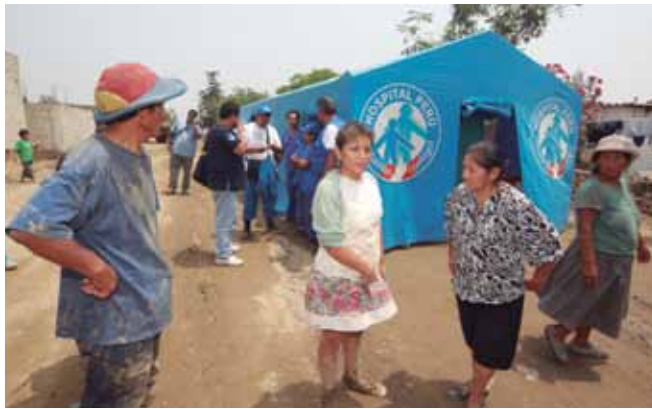
Qharikunawan, warmikunawan, wawakunawan iman iman rixurishanku Hospital Perúpa karpankunapi.