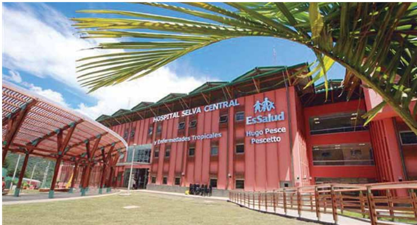
Hugo Pesce Pescetto" uspitalqa 15,600 metros cuadrados tupupin sayarin 8,178.51 metros cuadrados de área construidawan.

Chay uspitalpa puririyinmi hatun huñunakuyta kamarikun. Cha-