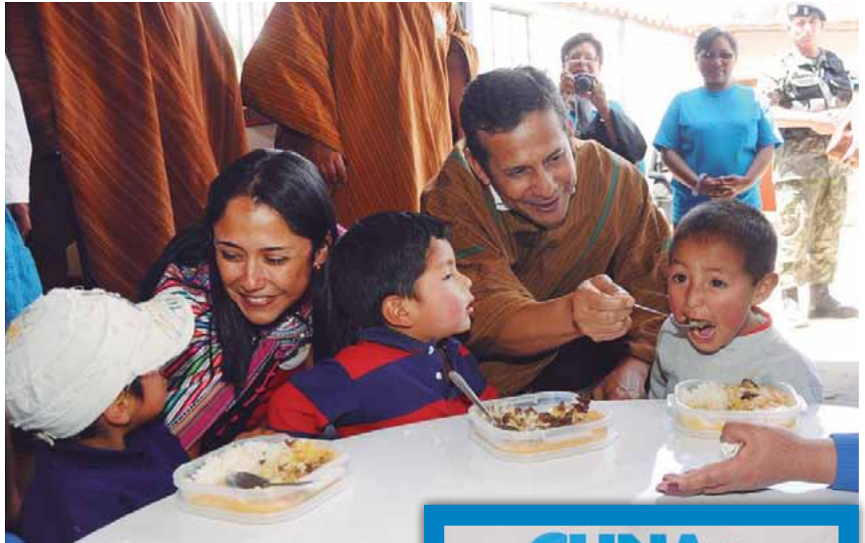
Wiraqucha Presidente de la Republica warminwan kуска, waylluyushanku Ayacucho wawakunata.

“Gubirnuqa kunanqa maskhashanmi lluy Perú runakunah kahlla kanankuta kay programapi: un país más integrado y con justicia social” kamarisqapi.