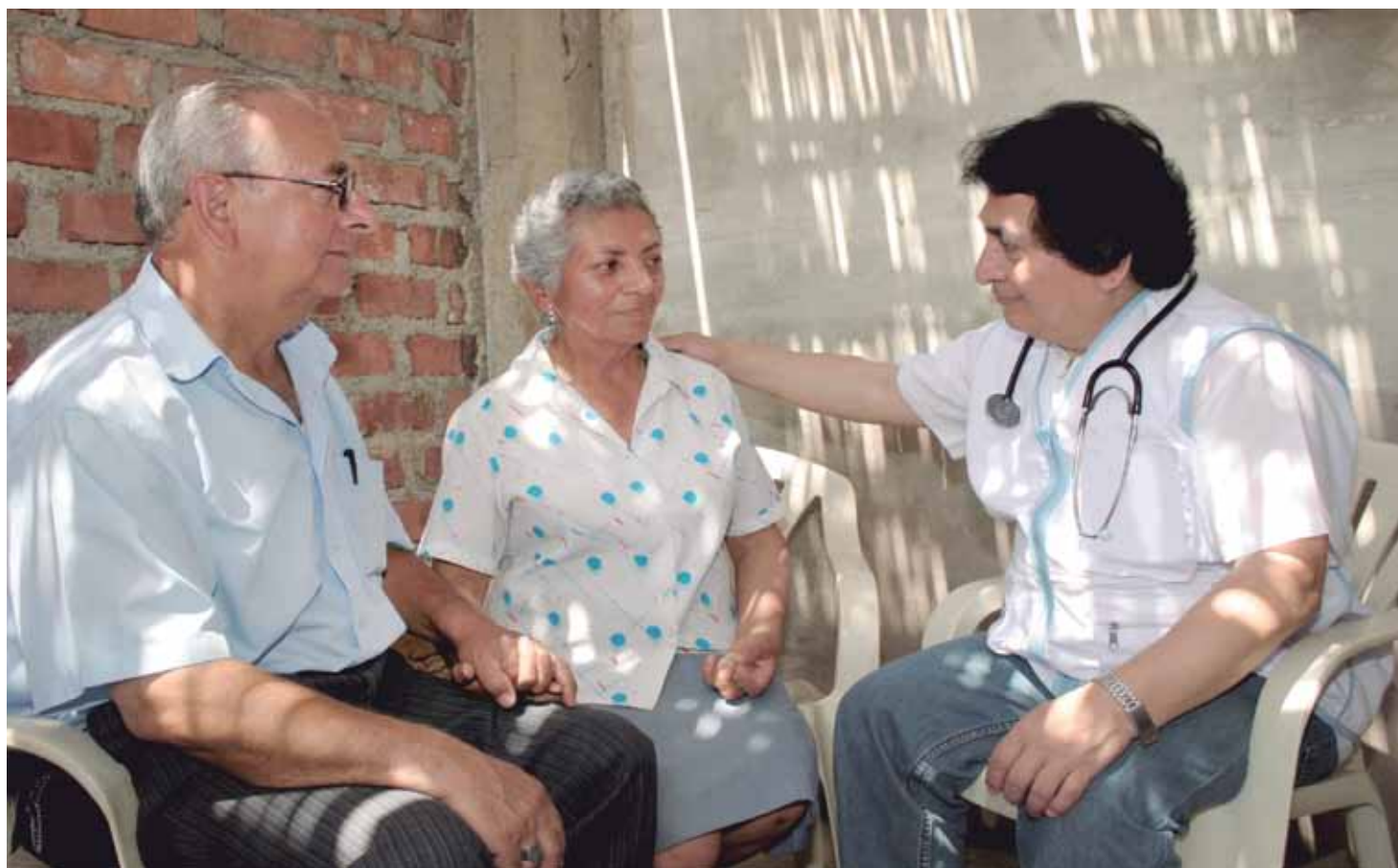
Atención preventivan phamilyakunaqa kusata puririchinqaku llahtanku uxupi.

C haypa sutinmi "nuevo modelo" nisqa. Chaytahmi puririchishan Gerencia Central de Prestaciones de Salud del Seguro Social. Kay ayllun ña puririshanña kay musuh llank'aytaqa "EsSalud Familia" y "Agentes Comunitarios de Salud" (ACS) nisqakunawan.