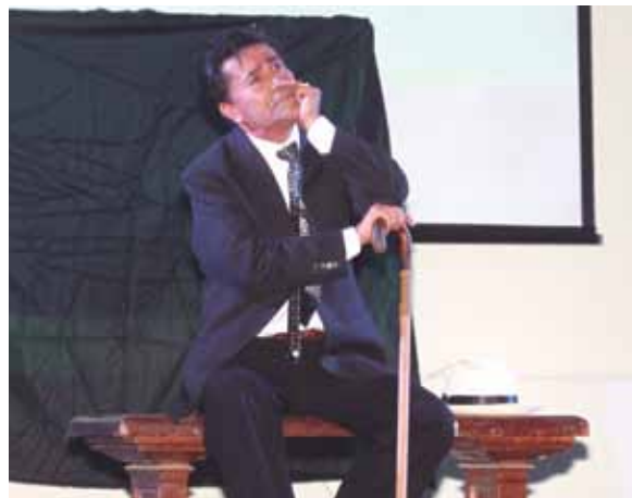
Uber Ramírezmi takirishan Los Heraldos Negros harawita.

Harawikuna uyarihkunaqa tukuy yuyayninkutan chuyarunku chay wañuyqa chaskinkuna chayamuhntin