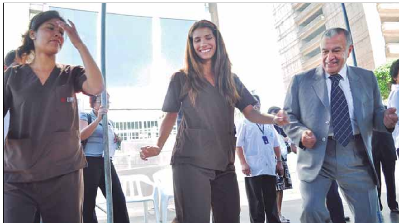
Qhali kawsanapahqa "ejercicio físico" sapa p'unchay ruwana allintatah mixuyunapis

Kay llank'ay qallariypiqa maskhasahkun "equipos de salud", tukuy imanatapisi asegurado wasinkunaman puririnapah, pikunan chaykunata yanapanqa ima. el recurso humano.