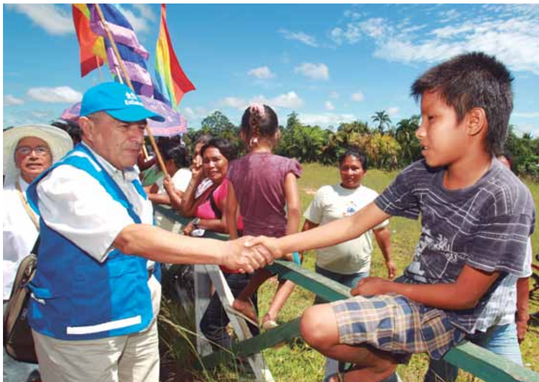
San Antonio El Estrechoh runankunan kususqa raymichashanku uspital llahtankupi rixurinanta.

San Antonio de El Estrecho distritoqa pusah chunka