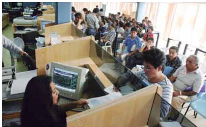
Agencia de Seguros de San Miguelmi Certificación ISOwan pilluyukun.