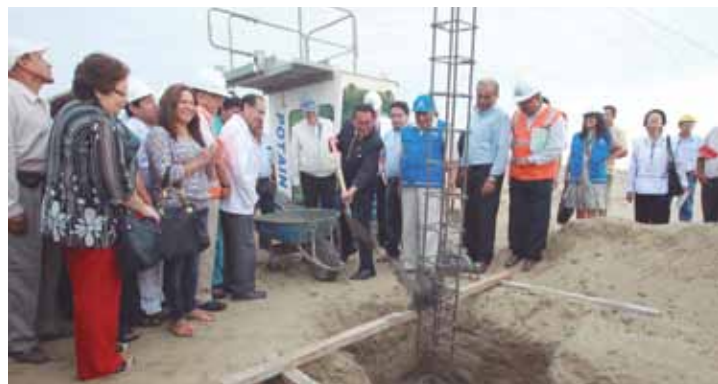
Ñan ruwakushañña Hospital de Alta Complejidad La Libertad departamentopi.

R egión La Libertadpin musuh Hospital de Alta Complejidad del Seguro Social sayarinqa. Chay uspitalmanmi suhta pachax pisqa chunka waranqa aseguradokuna puririnqaku. Chaypin rixurinqa runakuna La Libertad, Tumbes, Piura, Cajamarca, San Martín, Ama-