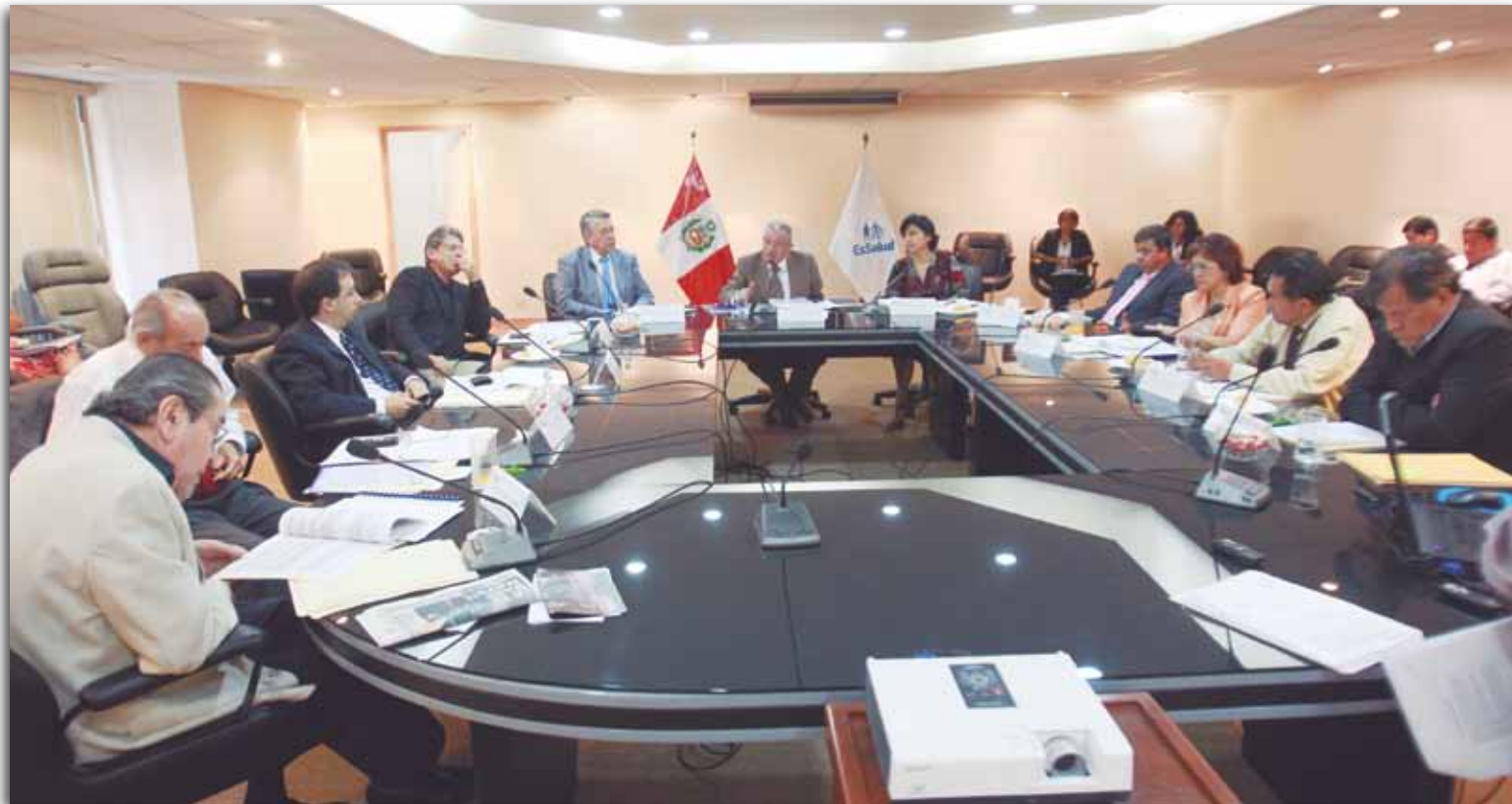
Consejo Directivo de EsSaludpi kahunan chaninchashanku qanchis killallapi kay aylluta kusa puririchisqankuta.

M anu manu 2010pi kashaspan EsSaludqa allin qulqiyuh rixurirun 2011pi. Chaytan ninku "Cifras en azul" nispa. Allintayá qulqitaqa gastakun imaynan huñun aseguradokunah churasqanta hinallan gastakun.