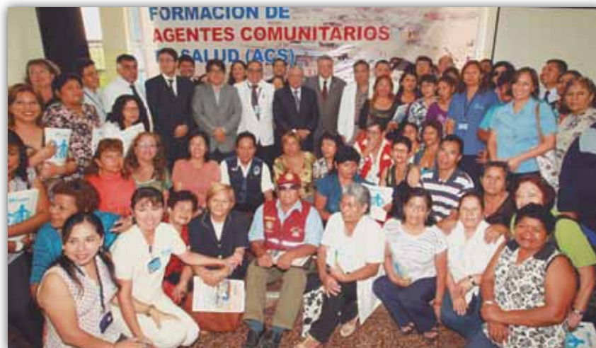
Kay iskay pachax agentes comunitariosqa yanapanqakun medicokunata asegurado qhali kayninta maskhaspa, phamiliakunah ima allin kayninta puririchispa.

Chay yachayqa qallariranmi 26 lunis marsupi Sede Central de EsSalud nisqa k'itipi. Chay hina yachaytahmi ruwakunallanqakutah sapanka hospitales nacionalespi, sapanka establecimiento de salud EsSaludpi.