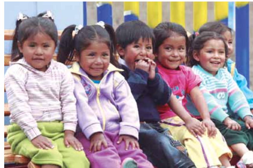
Estadon yanapanqa waxcha tayta-mamakunah wawan uywaytaqa.

Periódico qilqakunapis manan hayk'ahpas iskribirankuchu Socosmanta, huh hawa llahtakunamantapis mana chay suyukunapi maqanakuy, wañuchinakuy icha ima mana allinkunapis chay suyukunapi rixurihinqa. Manan waxcha kayninkumantaqa, yarqayninkumantaqa hayk'ahpis rimarankuchu.