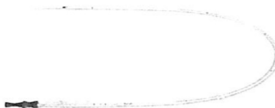
Fig. 1.: Cánula Venosa Femoral de Alto Flujo (no incluye diseño)