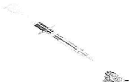
Fig. 1.: Hialuronato(sódico) 1% solución viscoelástica (no incluye diseño)