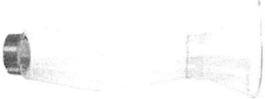
Fig 1.: Aerocámara espaciador – pediátrico (no incluye diseño)