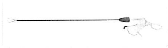
Fig. 1: Pinza de Agarre Endoscópica (no incluye diseño)