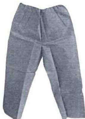
Fig.1: Pantalón descartable (no incluye diseño)