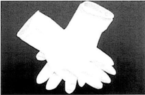
Fig 1.: Guante médico para simple uso (no incluye diseño)