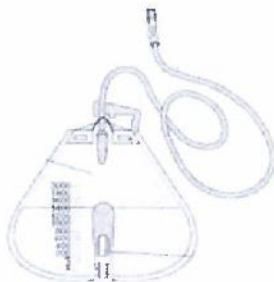
Fig.1: Bolsa colectora para orina adulto (imagen referencial)