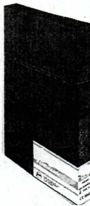
Fig. 1. Película radiográfica dental panorámica sensible al verde 15 x 30 cm (No incluye Diseño)