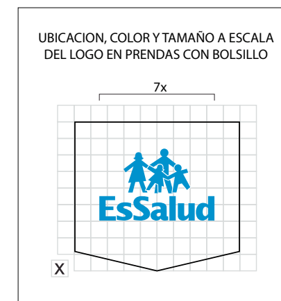
CUADRO No 1

UBICACION, COLOR Y TAMAÑO A ESCALA DEL LOGO EN PRENDAS CON BOLSILLO NOTA: En todos los casos considerar como referencia la proporción del ancho de la base del logo por lo que arroje de altura.