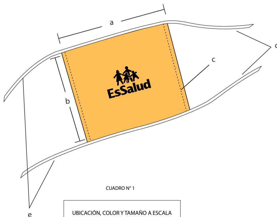
CUADRO N° 1