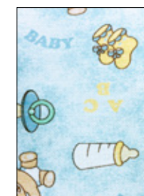
Diseño de tela

NOTA: Considerar solo el ancho del logo por lo que arroje de altura