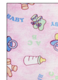
Diseño de tela

NOTA: Considerar solo el ancho del logo por lo que arroje de altura